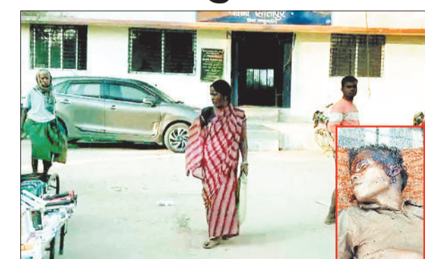
थाने के बाहर मृतक के परिजन, इनसेट में मृतक।