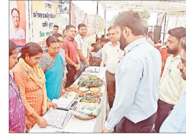
समाधान शिविर में जानकारी प्राप्त करते कलेक्टर।

इस अवसर पर कलेक्टर ने कहा कि मुख्यमंत्री विष्णुदेव साय की पहल पर पूरे राज्य में सुशासन की स्थापना और लोगों से सीधे संवाद कर उन्हें लाभांशित करने और सुशासन को घर घर तक पहुंचाने के लिए सुशासन तिहार का आयोजन किया जा रहा है। जिसके प्रथम चरण में 14 लाख से अधिक आवेदन प्राप्त हुए हैं जिसमें से 16 सौ से अधिक आवेदन आवेदन दुलदुला में प्राप्त हुए थे। जिसमें से 16 सौ से अधिक का समाधान भी सुशासन तिहार के दूसरे चरण में कर लिया गया है। उन्होंने कहा कि सुशासन एक सतत प्रक्रिया है इसे निरंतर स्थापित करने के लिए गांव की समस्याओं के गांव