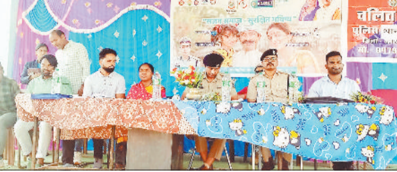
कार्यक्रम में उपस्थित अतिथि।

इस घटना से स्पष्ट होता है कि प्रशासन सोशल मीडिया के दुरुपयोग को लेकर पूरी तरह सतर्क है। धार्मिक सौहार्द को बनाए रखना हम सभी की जिम्मेदारी है और ऐसी किसी भी गतिविधि के खिलाफ सख्त कार्रवाई ही समाज की एकता और शांति की गारंटी है।